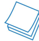
Pósteres y volantes