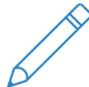
Actividades de votación